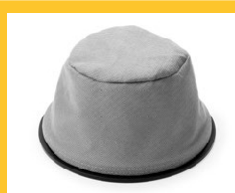
FILTRE TEXTILE (V 10) Code 3001038