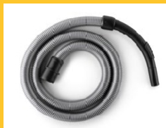
TUYAU FLEXIBLE Ø 32MM

Longueur du câble 2 m, idéal pour ne pas se gêner pendant le travail.