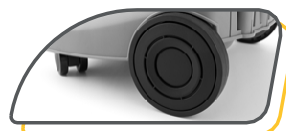
ROUES ARRIÈRE DE GRAND DIAMÈTRE