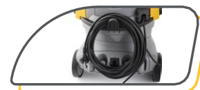
CÂBLE D'ALIMENTATION DE 10 M