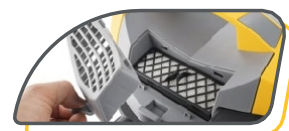
FILTRE ÉVACUATION D'AIR