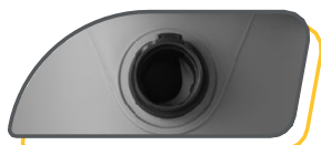
RACCORD TUYAU À BAÏONNETTE