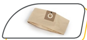
SAC FILTRE EN PAPIER