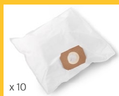
SAC EN PAPIER L 8 (V 10) Paquet de 10 pièces Code 6595040