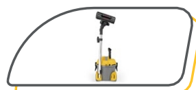
DISPOSITIF DE SUPPORT POUR LES ACCESSOIRES