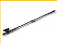
TUBE TÉLESCOPIQUE CHROMÉE

Il permet d'atteindre les endroits les plus difficiles.