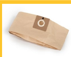
SAC EN PAPIER L 8 (V 10)

Les sacs en papier, les filtres fleece et les filtres textiles font partie de l'équipement standard de ces machines, garantissant d'excellentes performances de filtration et un environnement plus sain pour l'opérateur.