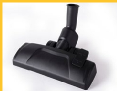
EMBOUT COMBINÉ SOL

Parfait pour le nettoyage des surfaces dures.