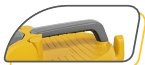
POIGNÉE ERGONOMIQUE ET PORTE CÂBLE