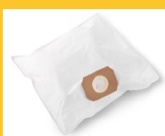
SAC FILTRE FLEECE L 4.3 (V 15)