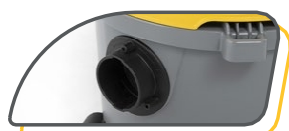
RACCORD TUYAU À BAÏONNETTE