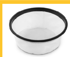
FILTRE TEXTILE (V 15) Code 3001054