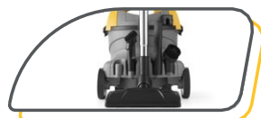
DISPOSITIFS DE SUPPORT DES ACCESSOIRES ET DU CÂBLE