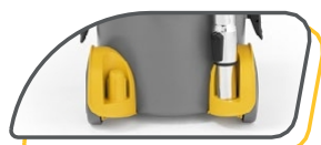
CROCHET FIXATION TUYAU À L'ARRIÈRE