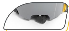
ROULETTES AVANT PIVOTANTES