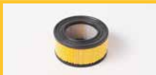
KARTUSCHENFILTER HEPA Er besteht aus H14-zertifiziertem Material, hält selbst den feinsten Staub zurück und hat eine Filterfläche von 0,29 m 2 .