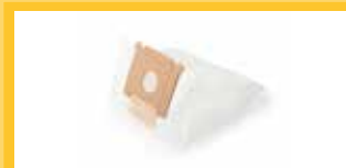
VLIESBEUTEL Mit einem Fassungsvermögen von 5 l.