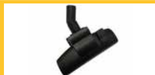
KOMBINIERTE BODENDÜSE Ø 32 MM Sie kann sowohl zum Reinigen von harten Oberflächen wie Böden und Parkett als auch zum Saugen von textilen Oberflächen wie Teppichen und Auslegware verwendet werden.