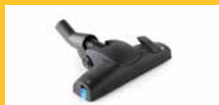
EINSTELLBARE KOMBINIERTE BODENDÜSE Ø 32 MM

Sie ist ideal für harte Oberflächen wie Fußböden und Parkett, aber auch für textile Oberflächen wie Teppiche und Auslegware. Sie ermöglicht es, die Haftung auf der Oberfläche in drei verschiedenen Stufen einzustellen, die direkt an der Düse ausgewählt werden können. Ausgestattet mit kleinen Rädern für eine einfache Reinigung. Das Gelenk an der Basis des Schlauchanschlusses sorgt für maximale Flexibilität, indem es die Düse in der optimalen Arbeitsposition hält. Für die BC Lithium Version.