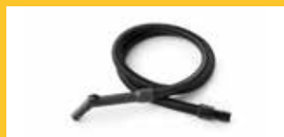
SCHLAUCH Ø 32 MM Länge 2,5 m. Ergonomischer Griff mit Saugstärkereger.