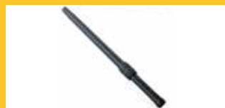
TELESKOPROHR Aus schwarzem Aluminium gefertigt ermöglicht es Ihnen, auch die schwierigsten Stellen zu erreichen. Für die BC Lithium Version.