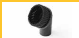
BÜRSTE Ø 32 MM

Mit Borsten, um Schmutz auch an den hartnäckigsten Stellen zu entfernen.