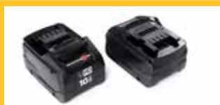
LITHIUM-AKKU 18V 10AH Sie gewährleisten eine Autonomie von 50 Minuten. Für die BC Lithium Version.