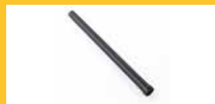
STARRE VERLÄNGERUNG 0,5 M * Mit einer praktischen Verlängerung aus schwarzem Aluminium kann die Maschine einen größeren Arbeitsbereich abdecken.