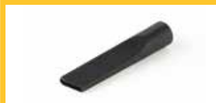
FLACHLANZE Ø 32 MM

Zum Saugen auch an schwer zugänglichen Stellen.