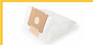
VLIESBEUTEL Packung mit 10 Stück 5 l Vliesbeutel.