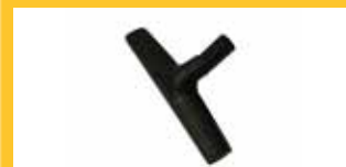
STAUBDÜSE FÜR BODEN Ø 32 MM Für die Behandlung von harten Flächen. Für die Versionen FC- und FT.