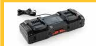
LADEGERÄT 8A Es ermöglicht ein schnelles Aufladen der Akkus (etwas mehr als eine Stunde für eine volle Ladung).