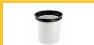
GEWEBEFILTER Für einen maximalen Motorschutz. Zur Ausstattung gehörend bei Version FT.