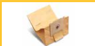
PAPIERBEUTEL Packung mit 10 Stück 5 l Papierbeutel.