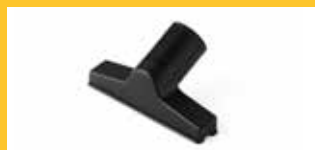
STAUBDÜSE GÄRTEN/ SOFAS Ø 32 MM

Geeignet für die Behandlung von Textilien.