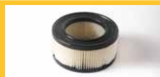
KARTUSCHENFILTER Mit Filterfläche 0,29 m 2 . Für FC- und BC-Lithium-Versionen.