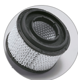
HEPA Kartuschenfilter (opt)